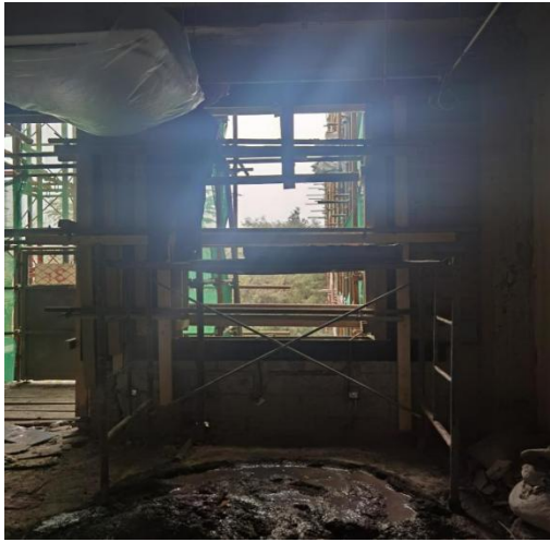
中段 2-3 层抱框柱施工