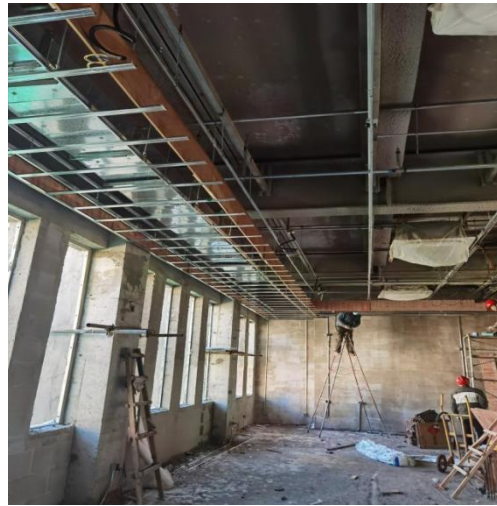
北段 4 层吊顶龙骨安装