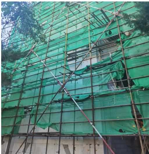
北段 2-4 层北、西立面保温施工