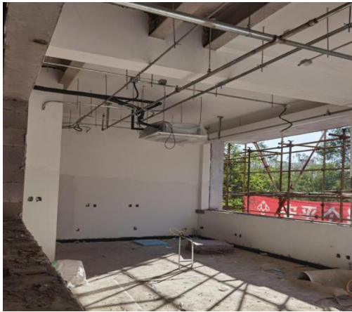
南段 1-4 层内墙刮第二遍腻子