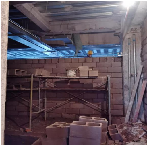
北段 1 层内墙砌筑