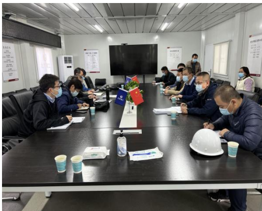
质监站首次监督及交底