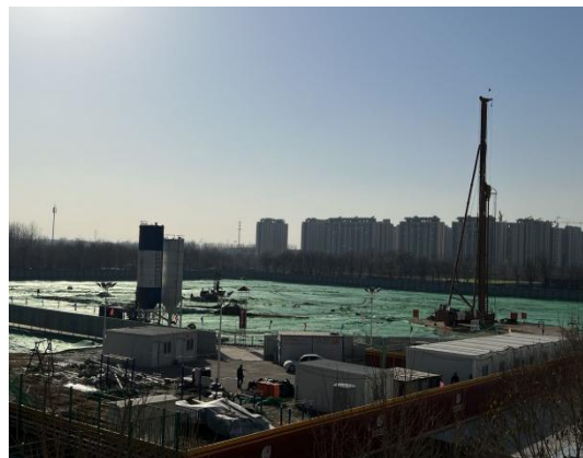
三轴搅拌机安装完成