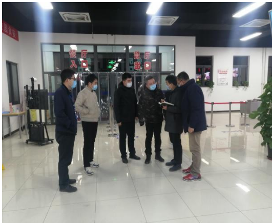
市教委及发改委视察工作