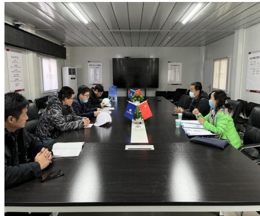
拱辰街道视察工作