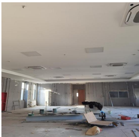
北段 4 层报告厅墙面龙骨安装