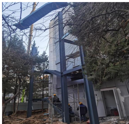
北段室外钢梯安装