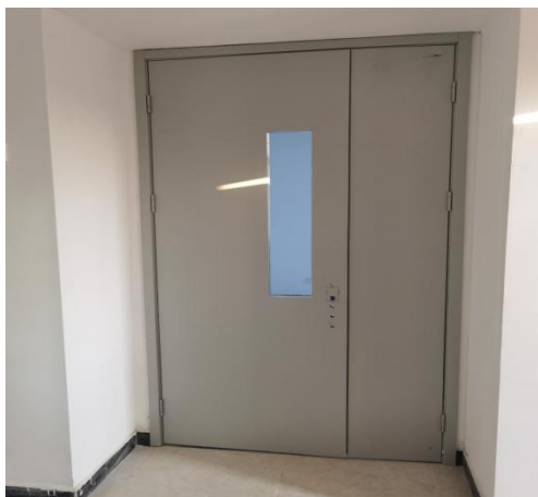
南段 2-4 木门安装