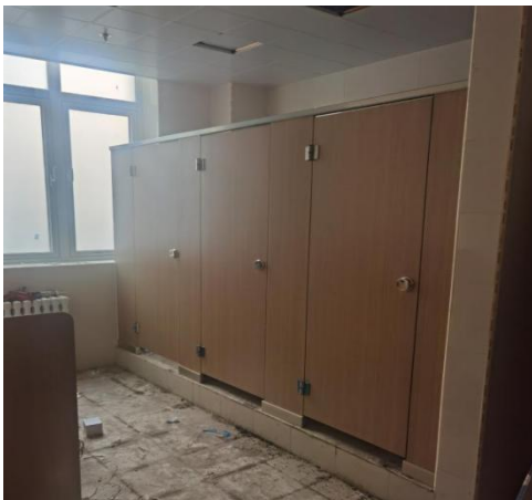
南段卫生间隔断安装