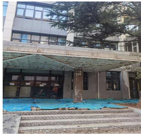
南段1层大门及台阶施工