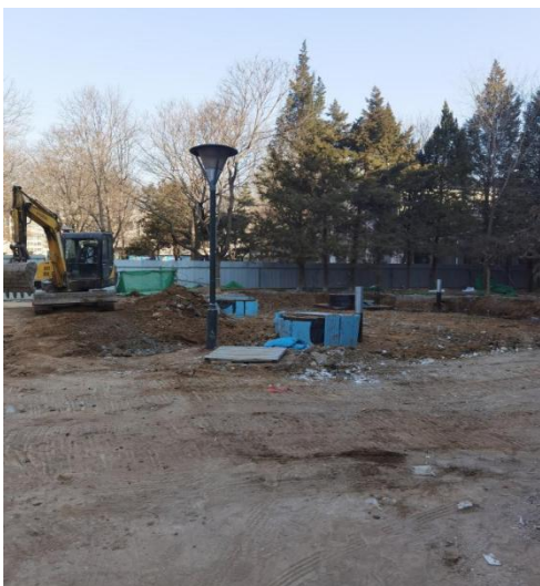
北段 1-3 层卫生间施工