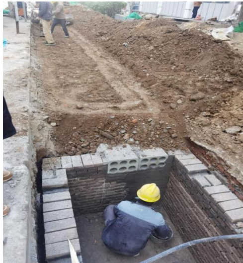
北段 1-2 层顶棚防火涂料施工