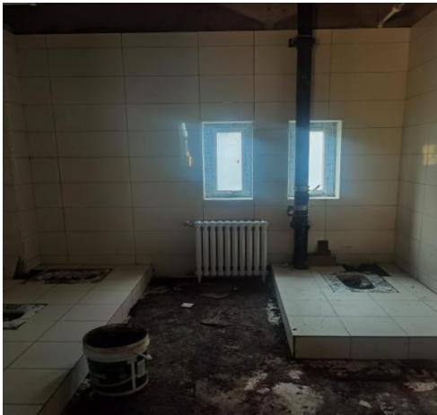
中段 1-2 层吊顶施工