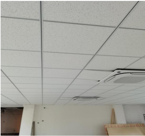
南段 1 层走廊及大厅地砖施工