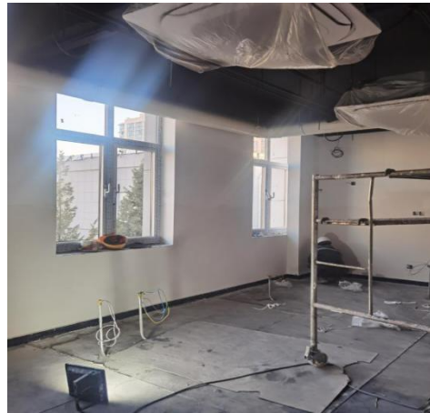
南段 1 层品评室吊顶安装