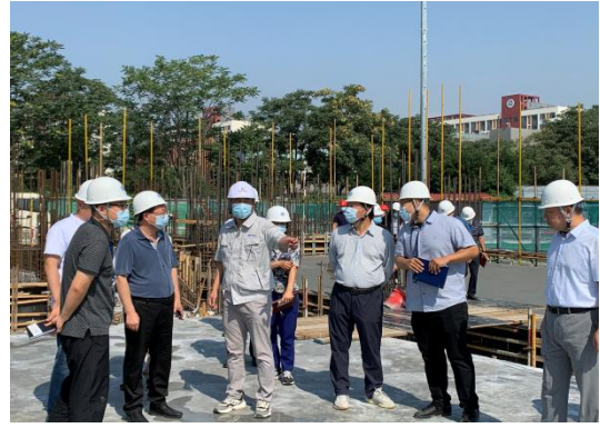
黄书记带队进行现场慰问并检查现场工作