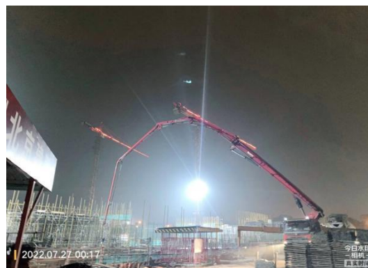
地下室顶板混凝土施工