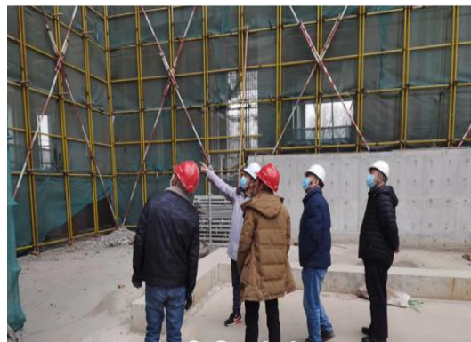
复工前安全联合检查