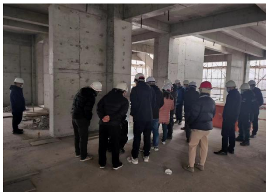
主体结构分部验收