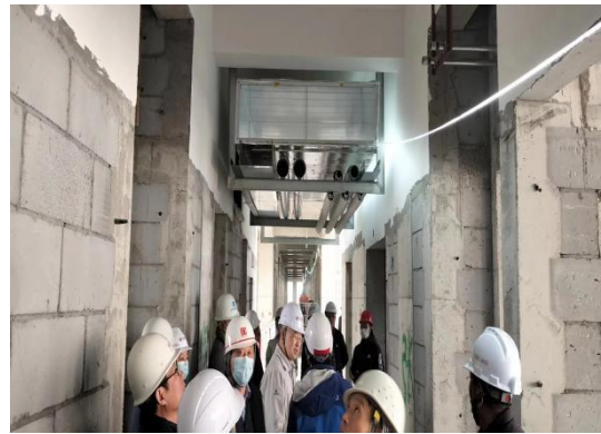
走廊管线综合排布样板