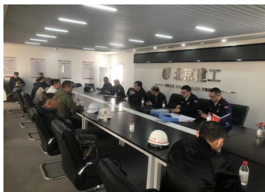
行管部门安全大检查