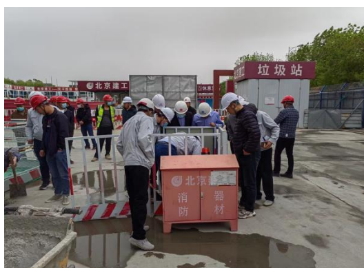
安全质量联合检查