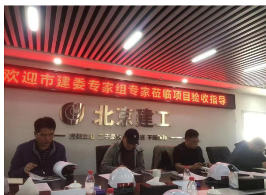
安全样板工地验收