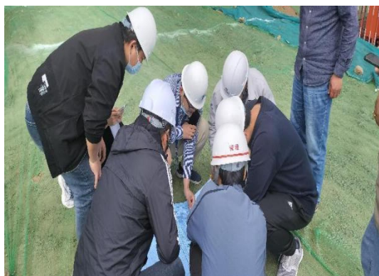
现场讨论图纸问题