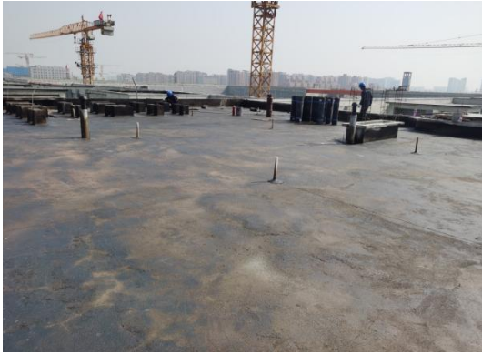
室内顶面装饰施工