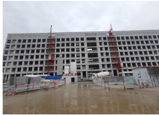
室内墙面基层施工