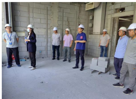
工程质量进度检查