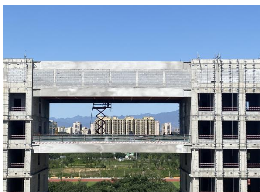
钢连廊防火涂料喷涂