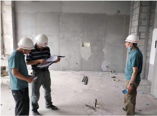
核查图纸与现场情况