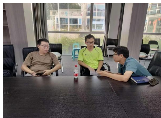
讨论工程技术问题