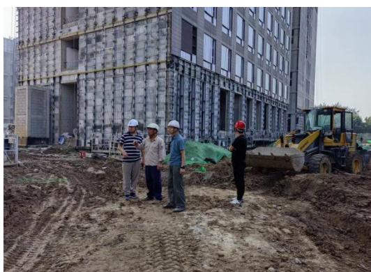
协调施工场地移交