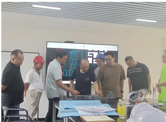
工程技术讨论会议