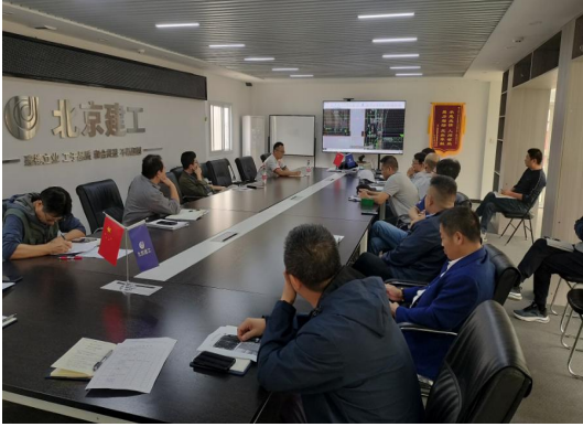
工程进度、技术会议