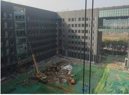
玻璃幕墙、雨棚施工