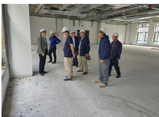
校领导莅临指导工作