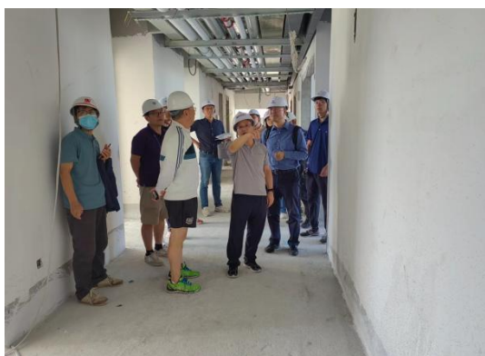
校领导现场指导工作