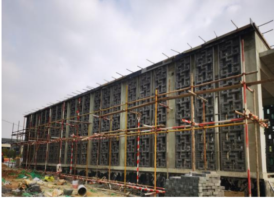
汽车坡道装饰施工