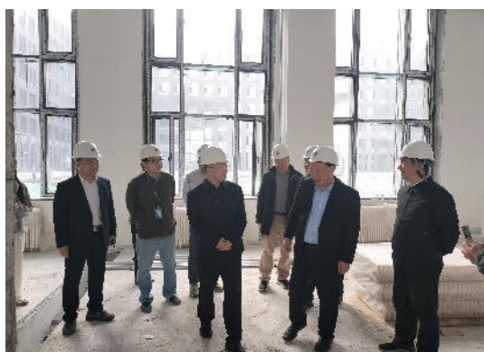
校领导莅临指导工作