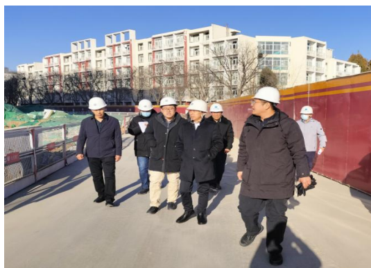
领导莅临检查指导